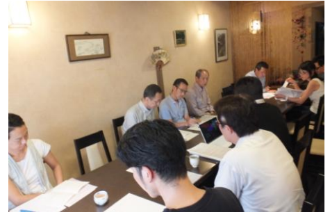
8月9日（火）「登希代の2かい」にて。参加者は14名でした。