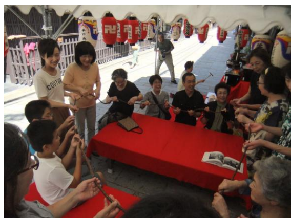
大きな数珠は昔のまま残っていました。

昔の記憶を頼りにではありましたが、経験者には懐かしく、初体験の子供には楽しい行事となったようです(^^)／