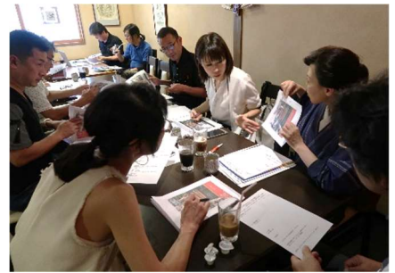
9月11日(火)「登希代の2かい」にて。参加者は13名でした。