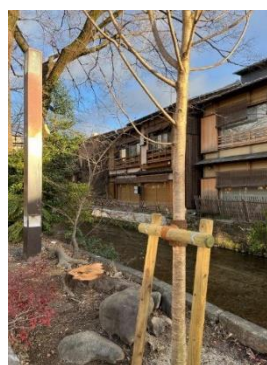
植樹された神代曙

今後定期的に話し合いを行い、より良い無電柱化計画となるように協議致します。内容に進展があった場合は皆様にお知らせの上、ご意見を頂くように致します。