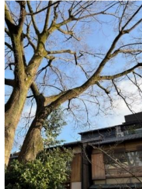
緑地帯のクスノキ

旧ハードロックカフェ南側白川緑地帯のクスノキが大きくなり過ぎて、白川の南側対岸の店舗様の屋根等に届く勢いでした。台風などによる倒木被害防止、そして桜の日当たり確保の為、最大限の剪定を依頼し、作業を終えました。